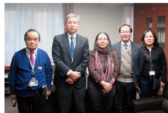
ベトナムから帝京大を訪問 e-ASIA Project January 19, 2014