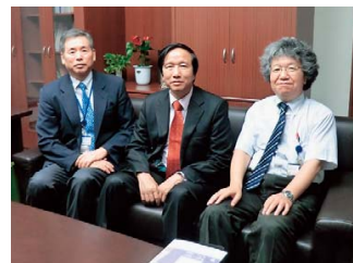
ベトナムVINMEC国際病院長Liem教授が帝京大病院を訪問 May 30, 2013