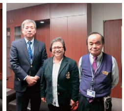
フィリピンから帝京大を訪問 Project, February 20, 2014 e-ASIA