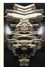
鈴木萌恵子《それ》2020年